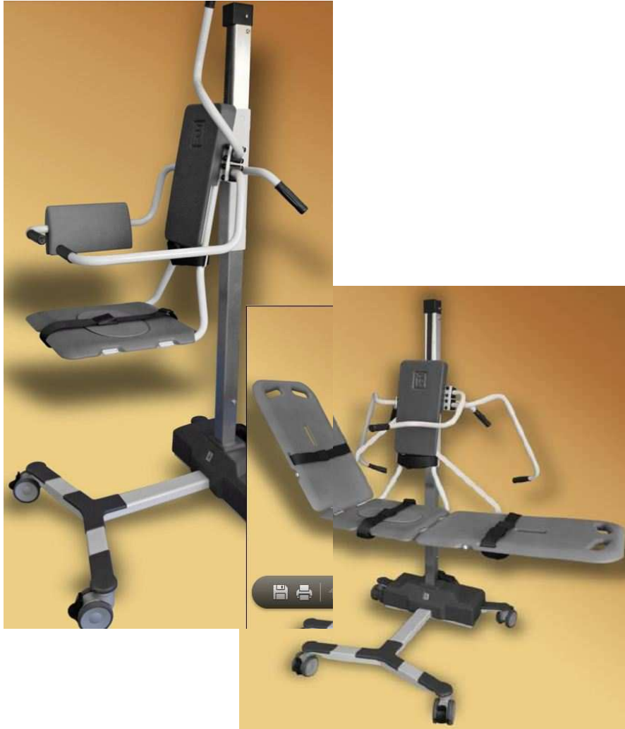
Elektro – Mehrzwecklifter